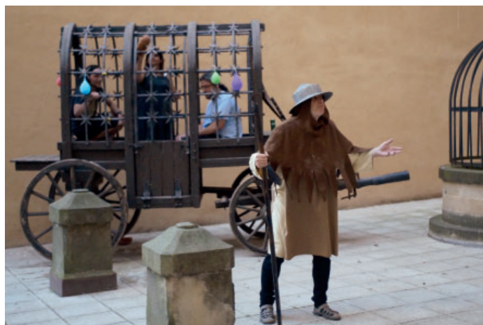
→ Vítačí scénka je letos opravdu pikantní!