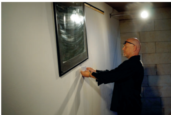
→ Marek Vašut odstartoval 45. ročník FEMADu svou vernisáží

Vašinka se nikdy nebránil humoru, i když šlo o humor poněkud truchlivý. Jistým druhem takového nezdočného humoru je i jeho stále neúnavná cesta k divákovi. Po roce 1989 očekával změnu chápání poezie a umění, jenže tvrdě narázil na konzumní mantinely. V roce 1994 založil své Krytové divadlo, kde působil jako herec, režisér a principál. Nezařaditelný Radim Vašinka byl nakonec v roce 2004 odměněn za svůj celoživotní boj o čistou poezii nejvyšším profesionálním oceněním právě zde na Poděbradských dnech poezie, když převzal Křišťálovou růži. A právě loni se opět vypravil do Poděbrad, aby při příležitosti svého významného životního jubilea převzal Zvláštní cenu festivalu FEMAD za celoživotní přínos českému ochotnickému divadlu s přihlédnutím k významnému podílu na formování FEMADu. A tím se stal živoucím důkazem, že rozdělování umění na amatérské a profesionální je značně pochybné dělení, protože nejdůležitější je přece kvalita, která přetrvává.