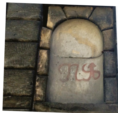
> Číslo popisné zámku